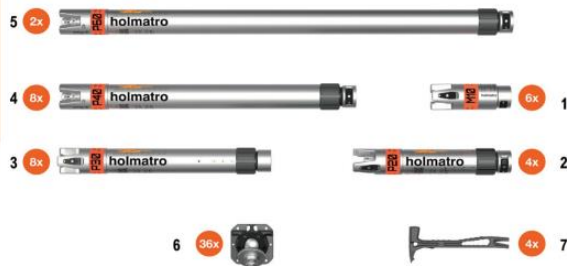
G175560 - JEU D'ÉTAYAGE DE TRANCHEE AVANCÉ AT-PS1