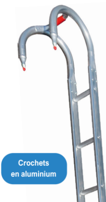
Crochets en aluminium