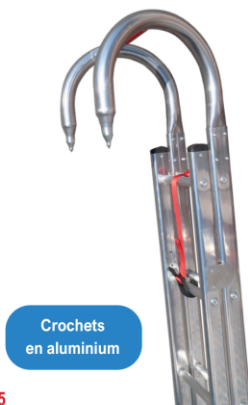
Crochets en aluminium