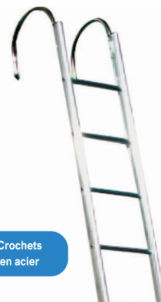
Crochets en acier