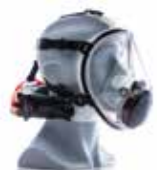
CLEANSPACE AVEC MASQUE COMPLET (2 TAILLES : S/M OU M/L)

Différents modèles disponibles : CleanSpace2, CleanSpace Ultra ou CleanSpace EX. Selon vos besoins, consultez-nous !