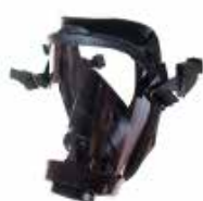
RACCORD 2 POINTS POUR CASQUE F1