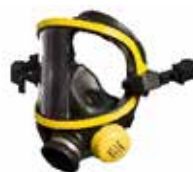
RACCORD 2 POINTS POUR CASQUE F1