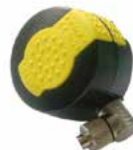
G126397 - Soupape SX-PRO

S'active dès la première inspiration. La soupape SX-PRO offre une très bonne ergonomie, un confort respiratoire extrême, même à un niveau de consommation très élevé. Munie du système Air-Klick. Conforme aux exigences de résistance à la flamme, selon la norme EN 137. Compatible avec tous les masques de la gamme HONEYWELL.