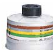
FILTRE COMBINÉ (GAZ + PARTICULES)