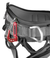
PORTE-MATERIEL KILO SUR HARNAIS