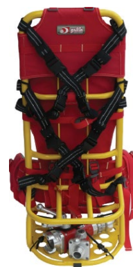
Claie de portage Pour jerrican G090037