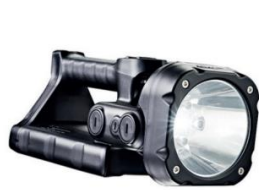
L-5000 AMM / L-5000 AMFM