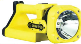
L-5000 Z0 / L-5000 Z0 F