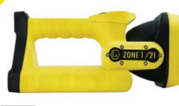
L-5000 Z1 / L-5000 Z1 F